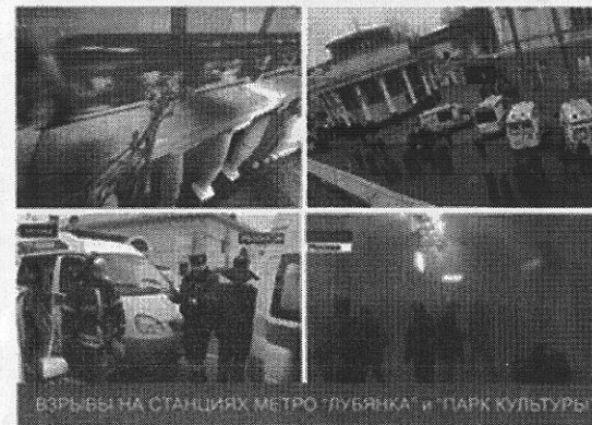
ВЗРЫВЫ НА СТАНЦИЯХ МЕТРО 'ЛУБЯНКА' и 'ПАРК КУЛЬТУРЫ'

Не спешите сразу уйти домой. Сначала свяжитесь с врачами. Врачи помогут выйти из шока и, если нужно, предоставят необходимое лечение. Помните: после того, как вас спасли, вам необходима медицинская помощь.